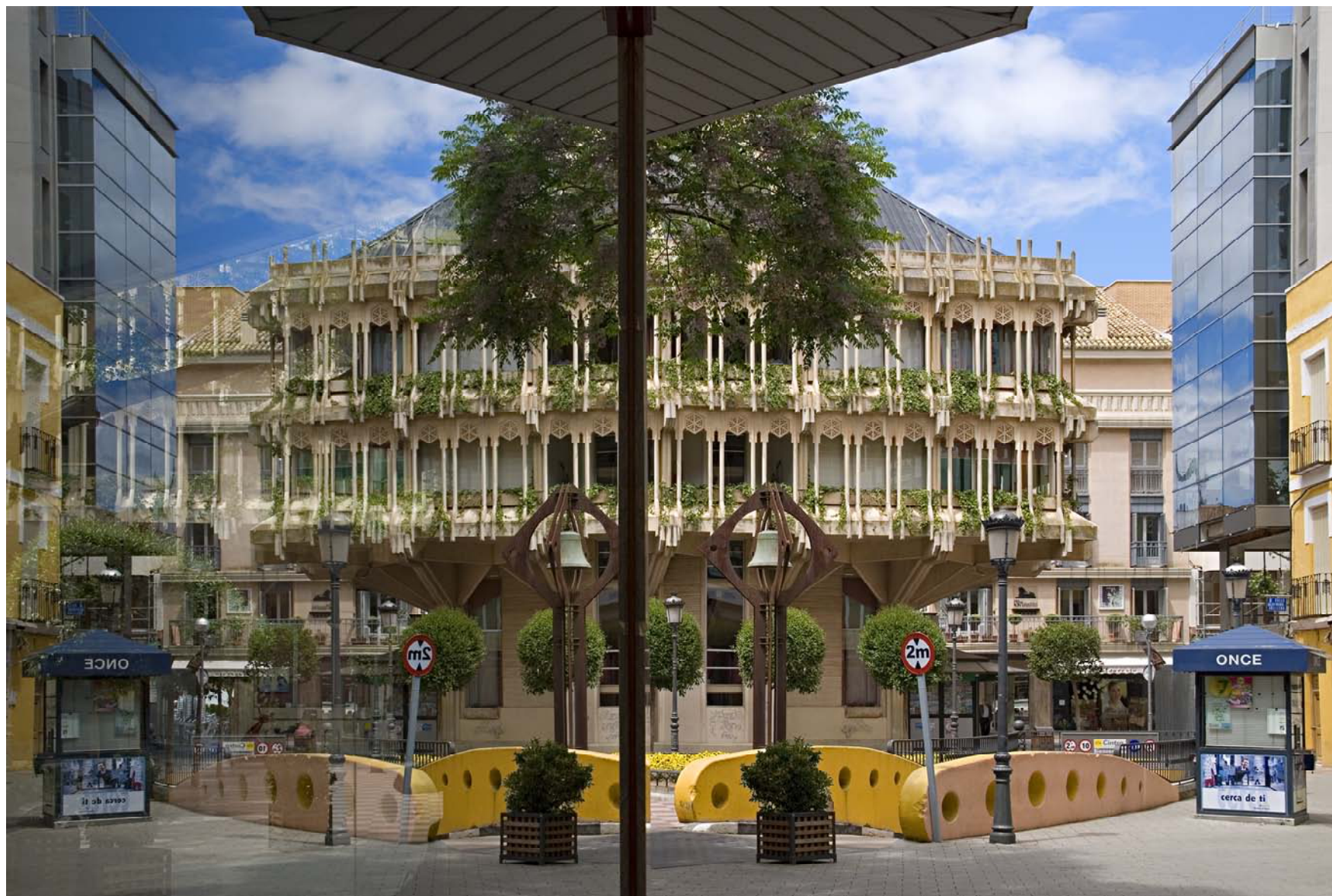
Ayuntamiento, Ciudad Real 2008. Fotografía, Impresión Lambda Siliconada en Metacrilato. 70 x 104 cm Town Council, Ciudad Real 2008. Photography, Silicone Lambda Print on Methacrylate. 70 x 104 cm