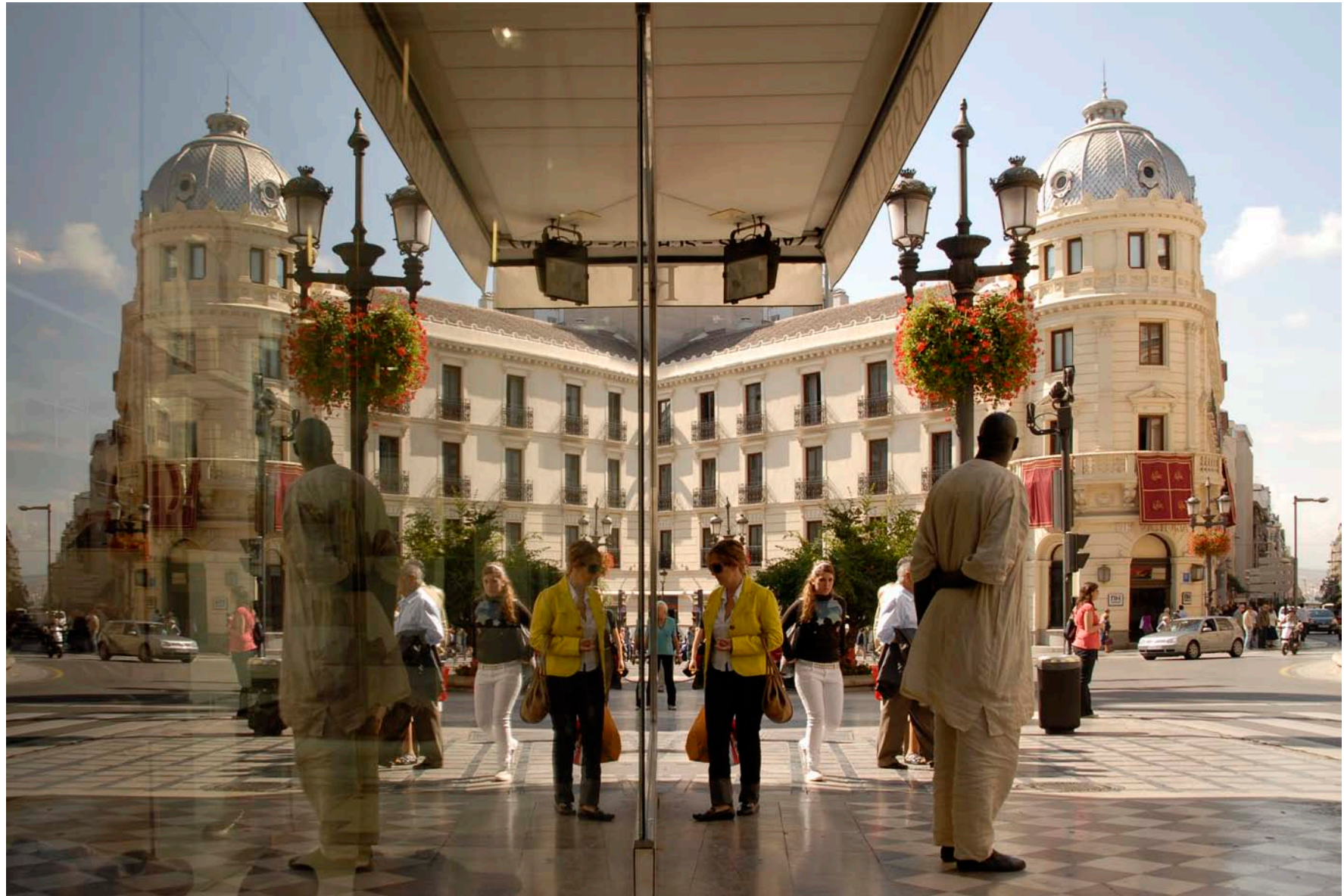
Hotel NH Victoria (Puerta Real), Granada 2008. Fotografía, Impresión Lambda Siliconada en Metacrilato. 70 x 104 cm Hotel NH Victoria (Puerta Real), Granada 2008. Photography, Silicone Lambda Print on Methacrylate. 70 x 104 cm